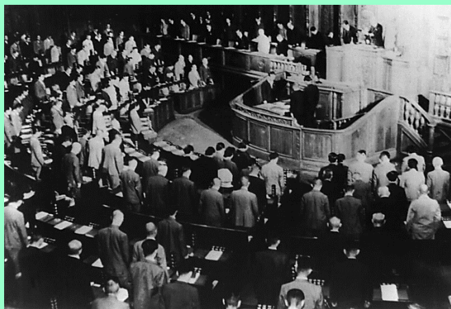
1946年8月24日衆院本会議 日本国憲法が衆院本会議で可決